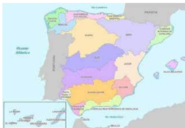
Mapa 1. Demarcaciones hidrográficas.

En la tabla 6 se comparan, por demarcación hidrográfica, las aportaciones medias de agua a los cauces producidas en el periodo 1940/41–1995/96 y las aportaciones medias anuales durante el periodo 1996/97–2005/2006.